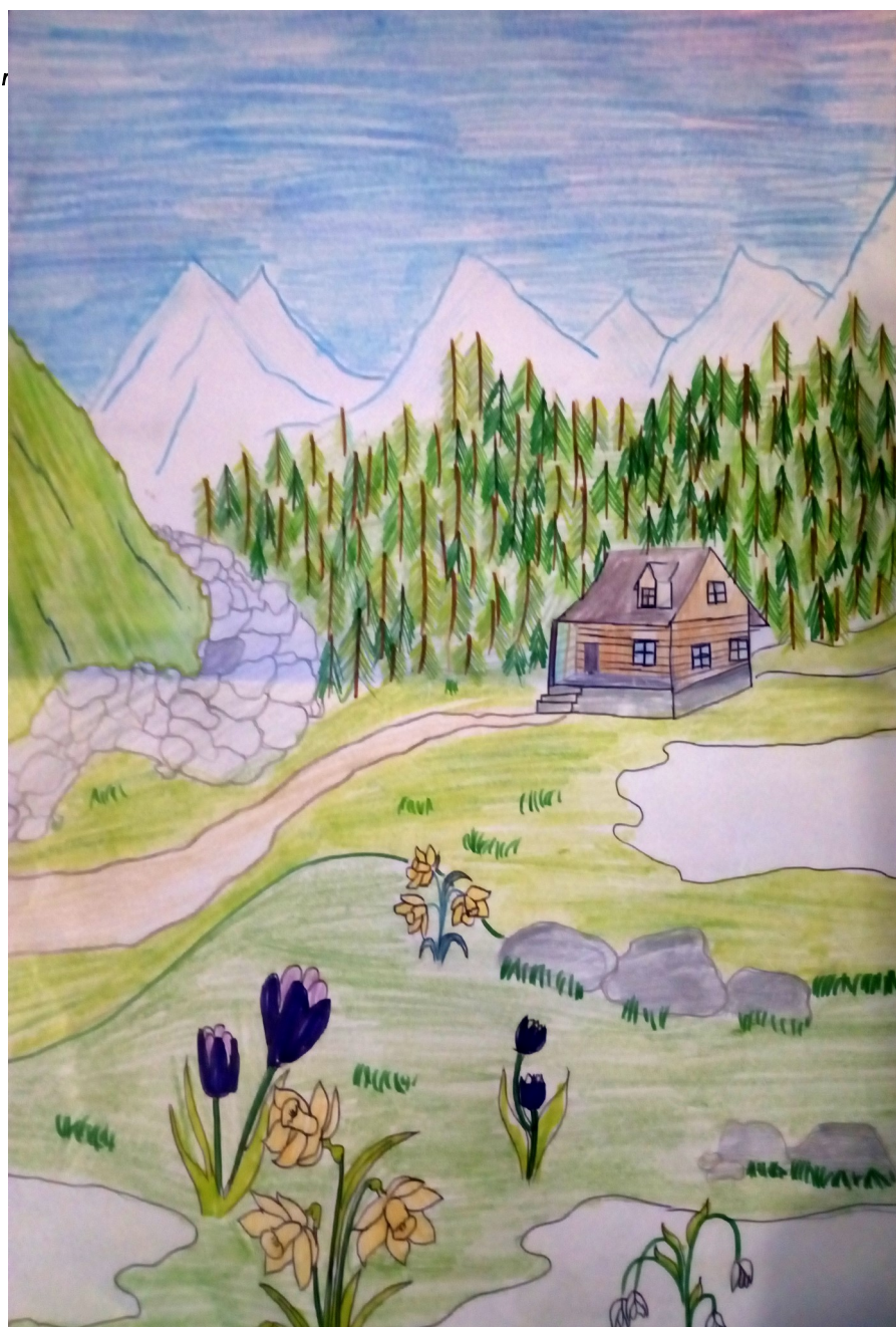
Rys. Anna Trzeciak